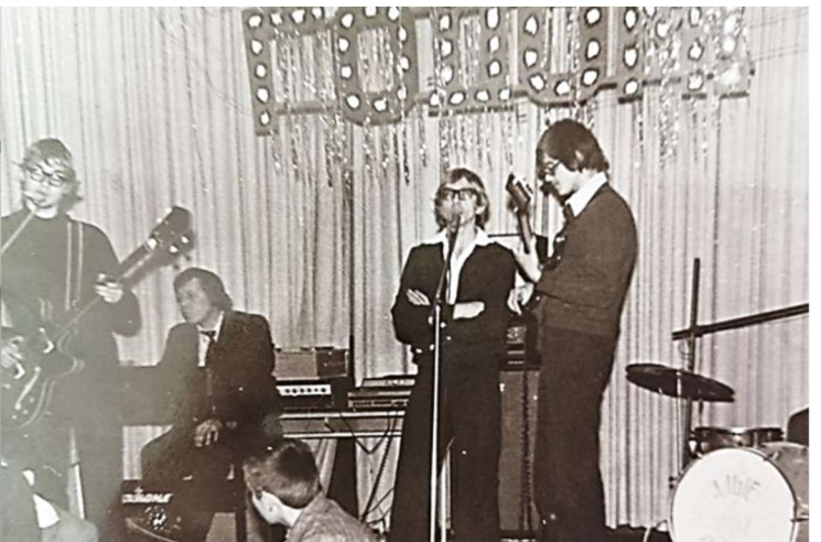
выступление школьного ансамбля