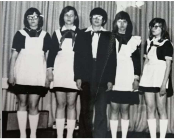
солирует на школьном концерте