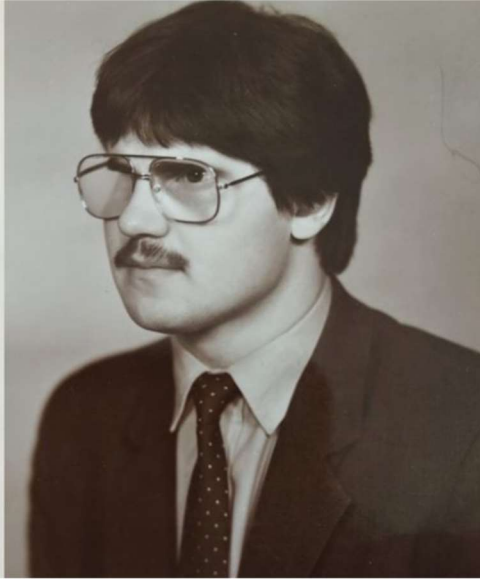
Студент музыкального училища