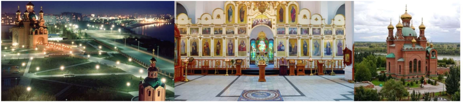
Благовещенский кафедральный собор города Павлодара

- Господь все устроит, только молись! Своими словами, от сердца старайся постоянно в своих мыслях молиться Иисусу Христу и Божьей Матери! Когда вернёшься домой, найди православный храм и ходи туда каждую неделю. Не торопись, присмотришь, что делают люди в храме, то и ты делай. Но главное – всегда молись, и Бог тебя не оставит!